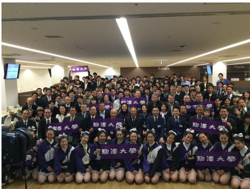
東京都支部だより を発送しました。