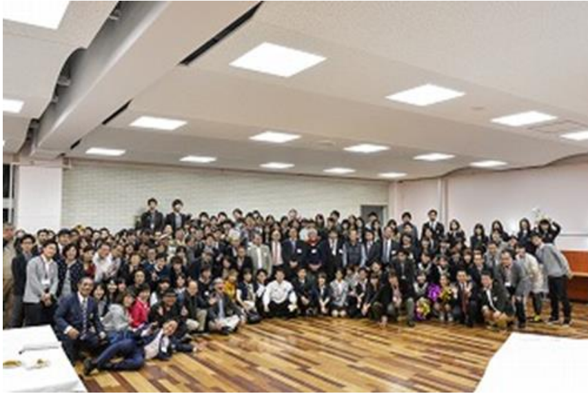
東京都支部会員&KOMAC集合写真