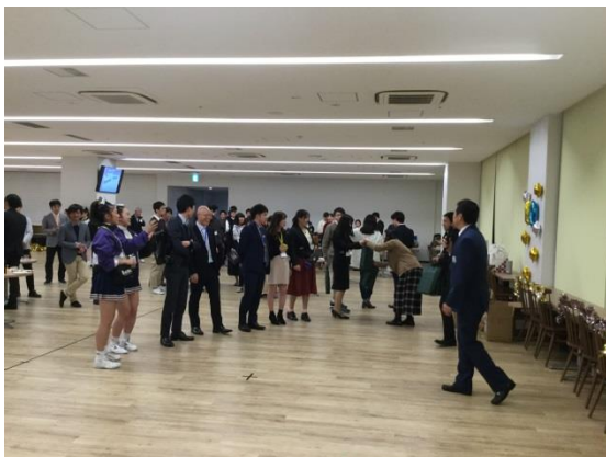
同窓会駒大グッズ抽選会

今回、総会運営に携わっていただいた、経営学部の先生方、KOSMOS の皆様と、体育会チアリーディング部「ブルージェイズ」の学生さんにこの場をお借りして御礼申し上げます。