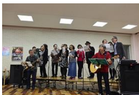
軽音楽部フォークソング研究会OB・OG会