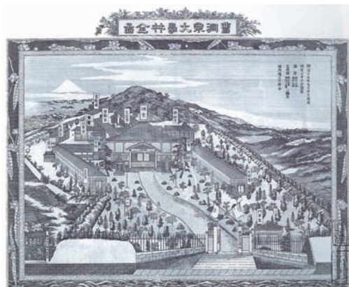
明治15(1882)年 そうとうしゅうだいがくりんぜんず 曹洞宗大学林全図