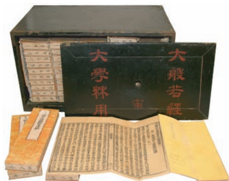
明治15(1882)年頃 だいはんにはんぎょう 大般若経 及び箱

今回、平成18年に本学図書館から発見された開校当初の資料を展示し、当時の学生の勉学や生活について紹介します。