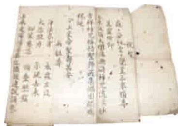
明治15(1882)年以前 そうとうしゅうだいがくりん 曹洞宗大学林 えこうぞうし 回向双紙