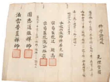
明治18(1885)年 しゅうがくしょうめいじょう 修学証明状