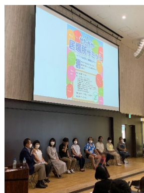
トークセッション