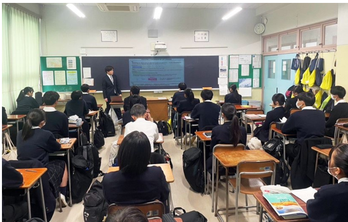
駒高生を対象に実施した様子