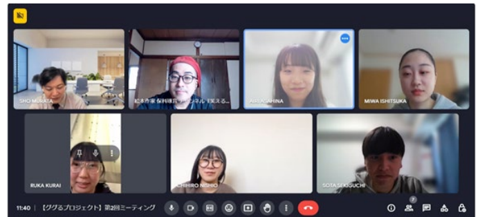
webミーティングの様子